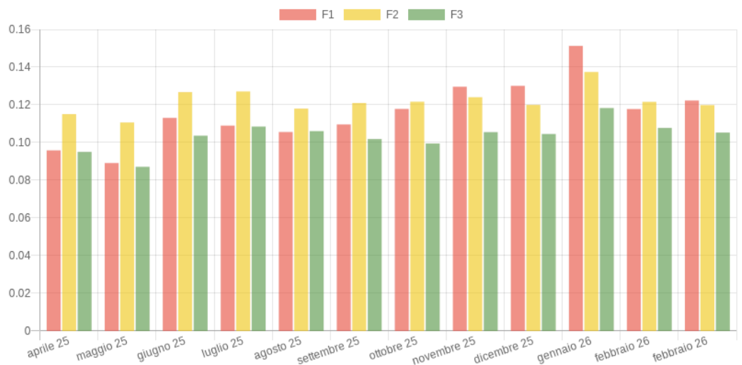
Grafico Indice (12 mesi)